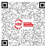
Anfahrt mit öffentlichen Verkehrsmitteln